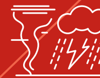
Fenomeni atmosferici estremi