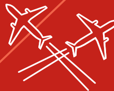
Aumento del traffico aereo