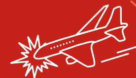
Incidenti causati dall'uomo