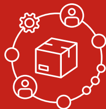
Gestione della catena di fornitura