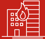
Disastri causati dall'uomo