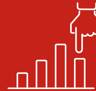
Mitigazione dei rischi

Siamo un partner molto solido quando si parla di proteggere i beni dei nostri Clienti. Lo facciamo da quasi due secoli.