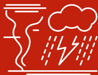
Fenomeni atmosferici estremi