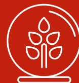
Pericoli per l'ambiente