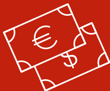
Tassi di cambio

È qui che entra in gioco Global Construction. Conosciamo bene il settore dell'edilizia e collaboriamo con la tua azienda sfruttando la nostra esperienza globale, le conoscenze locali e le conoscenze del settore per promuovere i tuoi interessi.